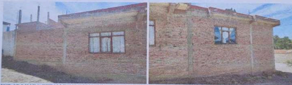
FOT. N° 5 Y N° 6. DETALLE CONSTRUCTIVO EXTERIOR Y ESTADO DEL INMUEBLE OBJETO DE LA LITIS. BLOQUE A.