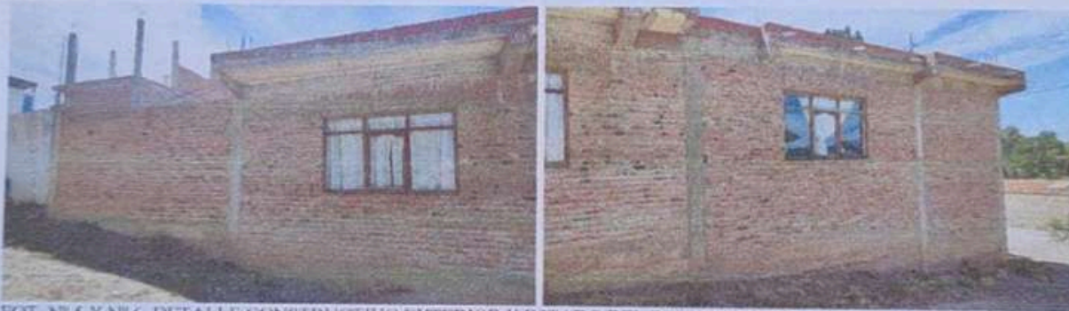
FOT. N° 5 Y N° 6. DETALLE CONSTRUCTIVO EXTERIOR Y ESTADO DEL INMUEBLE OBJETO DE LA LITIS. BLOQUE A.