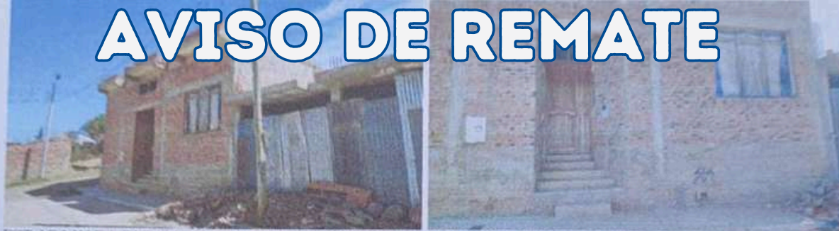
FOT. N° 3 Y N° 4. DETALLE CONSTRUCTIVO EXTERIOR Y ESTADO DEL INMUEBLE OBJETO DE LA LITIS. BLOQUE A.